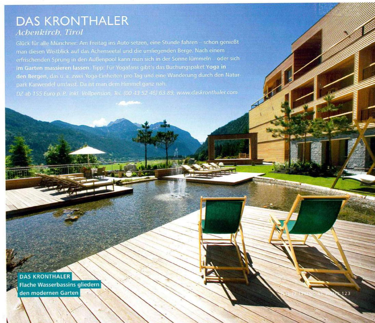
DAS KRONTHALER Flache Wasserbassins gliedern den modernen Garten

Glück für alle Münchner: Am Freitag ins Auto setzen, eine Stunde fahren – schon genießt man diesen Weitblick auf das Achenseetal und die umliegenden Berge. Nach einem erfrischenden Sprung in den Außenpool kann man sich in der Sonne lümmeln – oder sich im Garten massieren lassen. Tipp: Für Yogafans gibt's das Buchungspaket Yoga in den Bergen, das u. a. zwei Yoga-Einheiten pro Tag und eine Wanderung durch den Naturpark Karwendel umfasst. Da ist man dem Himmel ganz nah. DZ ab 155 Euro p. P., inkl. Vollpension, Tel. (00 43 52 46) 63 89, www.daskronthaler.com